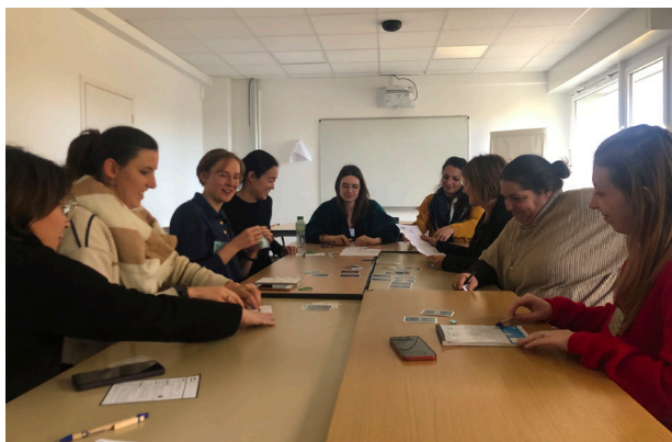
写真：初対面の地域の近い同業が丸一日集まり、ゲームを通して日頃の仕事上の悩みについて解決を目指し、広く福祉の発展について話し合う（筆者撮影）

職業の社会的意義を主張するためにも専門職の厚みがものをいう。エドゥケーター出身の研究者、ジャーナリスト、漫画家、映画監督、そのようなクリエイティブな広がりがあるからこそ、さまざまな手段でエドゥケーターの仕事の価値を広く伝える結果になっている。