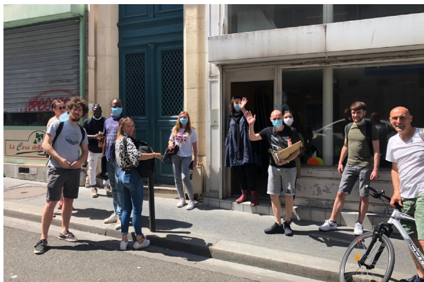
写真：パリ市路上エデュケーター

より、一週間現地、一週間座学の形で「知識、実践知、生き方と生きる姿勢」を同時に学ぶことが重視されるようになり、1950年に現在のスタイルである3年の養成課程で現場と座学が半々と規定された。1967年に国家資格化され、この時に児童保護から内容が広げられ「知的障害、身体障害、行動トラブル、社会的困難」が養成課程の項目に加えられた(Dréano 2015)。予防分野の花形である事務所を持たず若者への声かけにより支援をおこなう路上エデュケーターは戦後の浮浪児を大人たちが仕事帰りに連れて帰り寝泊まりさせ、地域の商店に仕事を探し与えるという活動が認められて制度化したものだ。子ども専門裁判官や小児精神科医が「自由の中でこそ若者は自由についてより良く学ぶことができる」とし、施設や病院や少年院を必要とする若者を減らす取り組みとして政府に全国的な運用を促した。市民がボランティアとして活動を始め、国が福祉として担うことになったときに現場にいる団体に活動を委託するというフランスの福祉の典型的な流れである(Peyre 2006)。施設に隔離するのではなく、地域内で暮らしを作ろうとした。