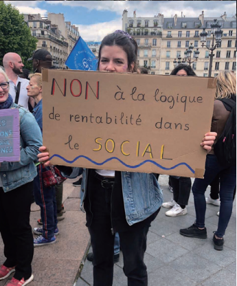
「社会福祉に採算性の原理を求め ることに反対します」。2022年 には、80万人のソーシャルワーカー に、月2万7000円の昇給が実現

いちばん関わりのある機関のソーシャル ワーカーが、家族のまわりに福祉をコーデ ィネートし、家族支援の全体像を把握する ・問題を指摘し解決を当事者に期待するの ではなく、子どもと親のまわりにチームを構成 し、親と子それぞれがよりしあわせに暮ら せる方法をいっしょに探す