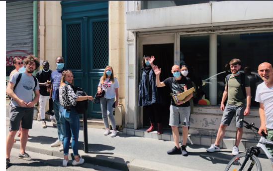
事務所を持たず地域密着型で声かけをする路上エデュケーター。地域で子どもの育ちを支えようと制度化された